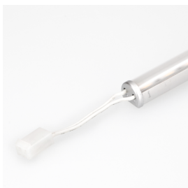
ACCABLECOPRFWUX400 Câble 1mm 2 400cm avec prise femelle Würth 7A