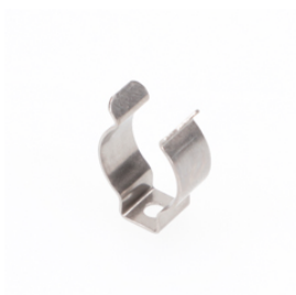
ACLIP14FICLIPSXX180 Clip de fixation vissés - orientation à 180° maximum