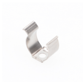
ACLIP14FICLIPSXX040 Clip de fixation vissés - orientation à 40° maximum